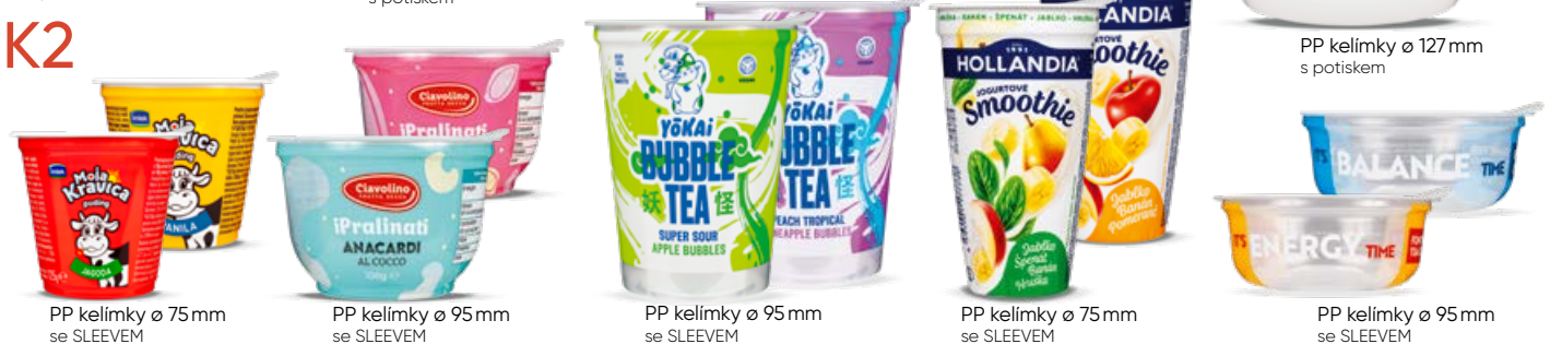
PP kelímky ø 75 mm se SLEEVEVEM