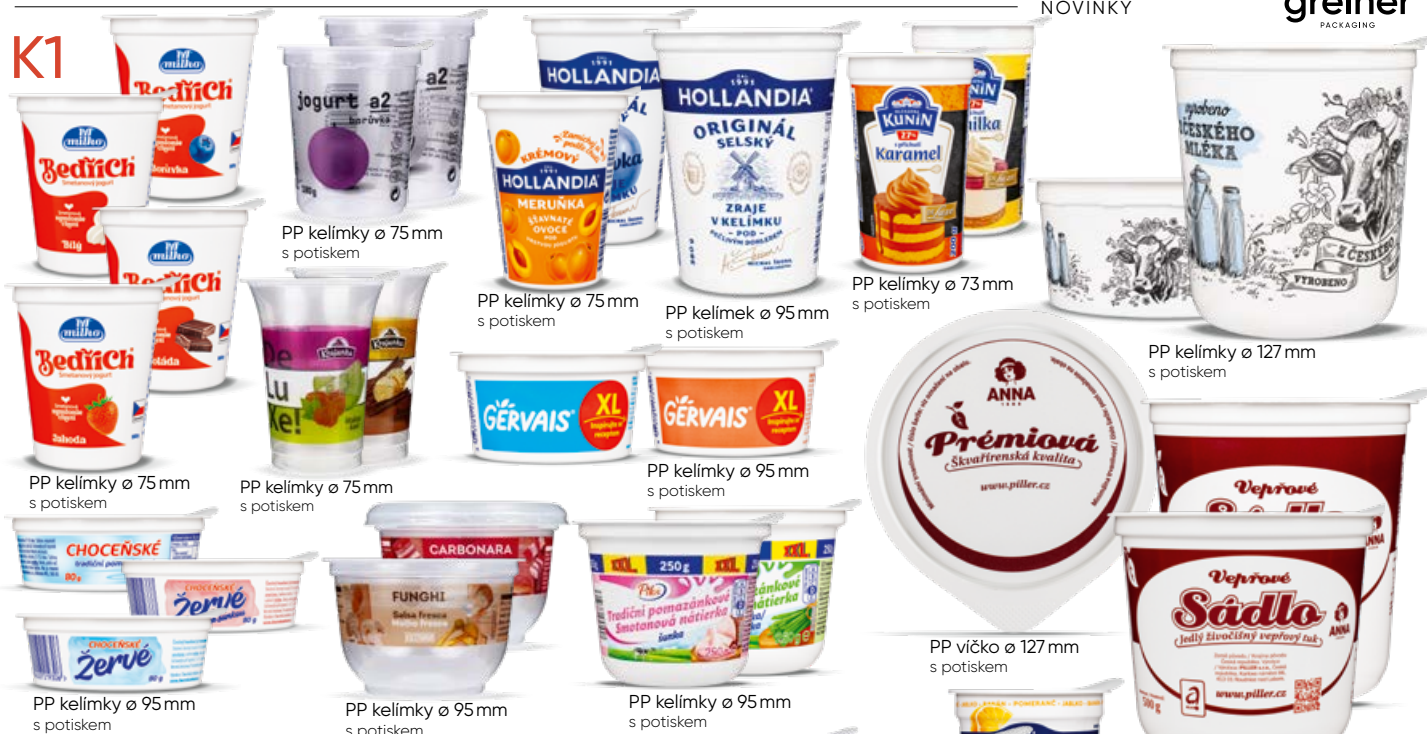
PP kelímky ø 75 mm s potiskem