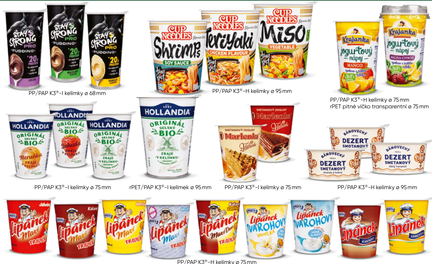
PP/PAP K3 ® -I kelímky ø 68mm

kelímky jsou 100% recyklovatelné | minimalizují množství plastu o více než 30% | papírový segment obsahuje až 100% recyklátu